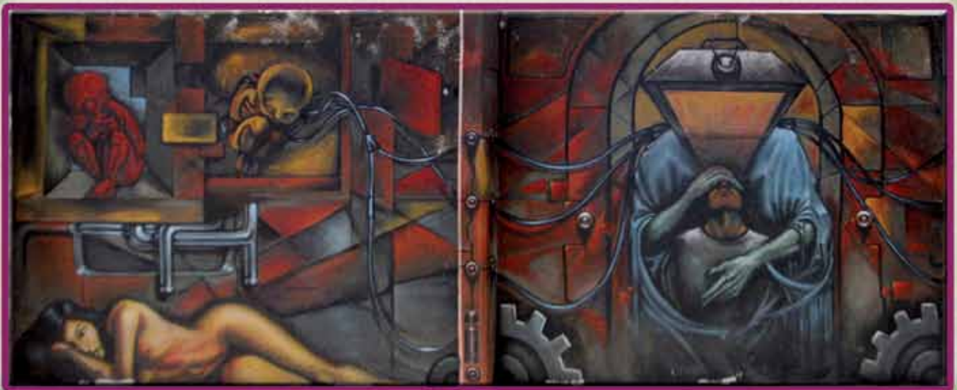
Detalle de mural del plantel Belisario Domínguez , GAM 1