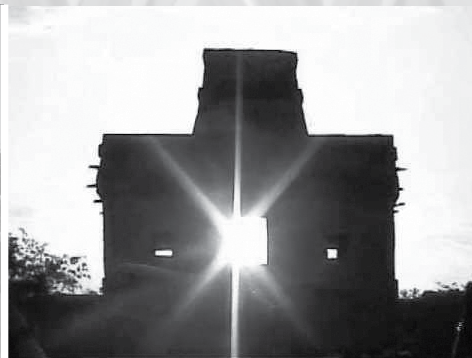
Templo del Sol, Dzibilchaltún