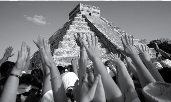
Castillo de Chichén-Itza

La palabra "equinoccio" proviene de los vocablos griegos euqus que significa "igual" y nox que se traduce como "noche", y se refiere al evento astronómico en el que el día dura exactamente lo mismo que la noche. Anualmente ocurren dos equinoccios, el de primavera y el de otoño que dividen al año en cuatro estaciones.