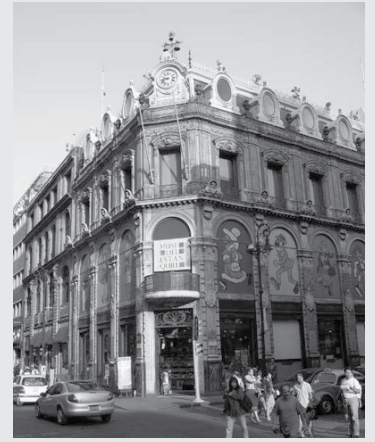
Museo del estanquillo.

Impulsado por el Gobierno del Distrito Federal, la empresa privada y el ocurrente y concurrido Monsiváis, este museo alberga actualmente la exposición México a través de las causas , la cual recomendamos a detalle por ser la muestra de los pasajes de una historia nacional desempolvada y lejos de lo oficial.