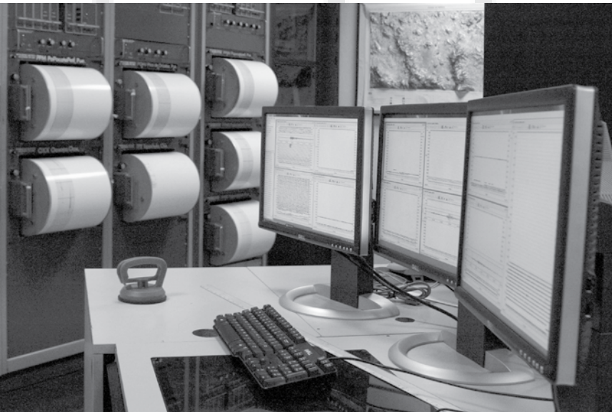
Equipo de medición sísmica

equivalente a mil 500 bombas atómicas, como la arrojada en Japón durante la Segunda Guerra Mundial.